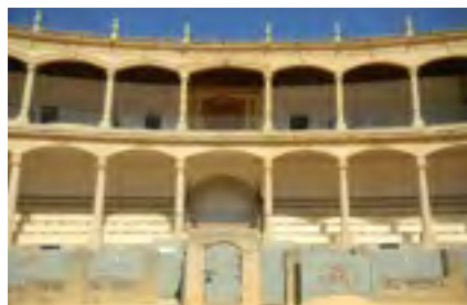
Plaza de toros de Ronda, Málaga