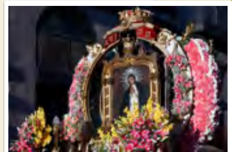
Procesión de La Paloma en Madrid (2007)

Es una habanera (un género de canción lenta para la danza que surgió en Cuba a principios del siglo XIX) cantada por Julián y Susana, que discuten sobre los planes de Susana para la verbena.