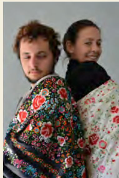
Foto menos tradicional de pareja con mantón de Manila