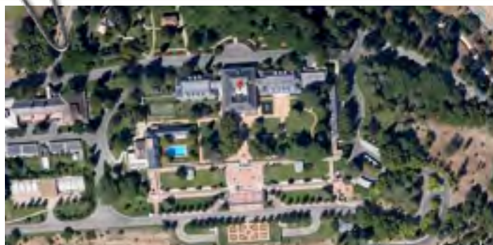
Vista del Palacio de la Zarzuela