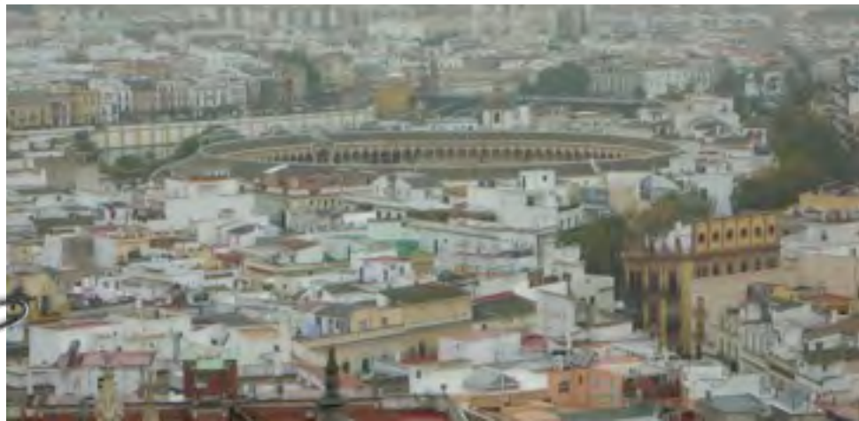
Vista de la plaza de toros de Sevilla desde la Giralda